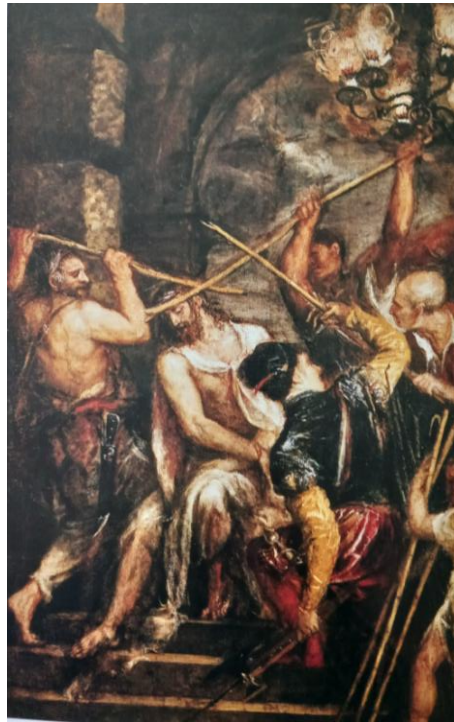
Le Couronnement d'épines (Alte Pinakothek, Munich)

Ici, c'est une véritable dramaturgie, et la matière avec laquelle il peint, qui est l'huile, dit quelque chose de la douleur d'un corps défiguré.