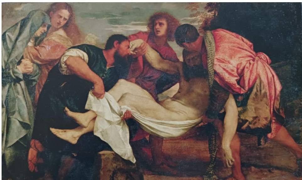
La Mise au tombeau, vers 1525. Huile sur toile, 125 x 148 cm. Musée du Louvre.

D'autres thèmes, en éventail : vous avez un déclinement des formes à travers l'abaissement. Et cet abaissement nous permet de comprendre qu'il y a un enfouissement dans la mort, et une densité d'émotion extrêmement forte, jusqu'à cet autoportrait du Caravage qui porte les jambes du Christ.