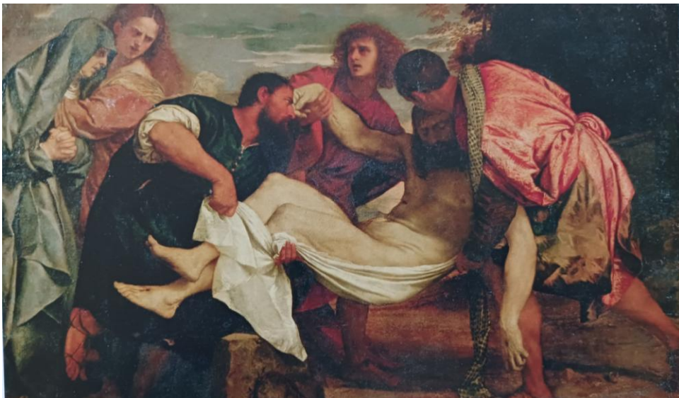
La Mise au tombeau. Vers 1525. huile sur toile. 148 x 212 cm. Musée du Louvre. Paris.

Les figures centrales ressortent sur les tons de terre et de vert du paysage, dans ce rapport entre le blanc lumineux bleuté et le rouge, de cette chemise et de ce voile, de ce bleu violet avec le rouge chaud de l'habit où il reste quelque chose d'un sang versé.