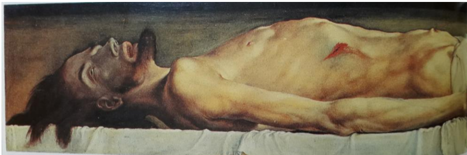
Le Christ au tombeau. 1521/22. Détrempe sur panneau. 30,5 x 200 cm. Kunstmuseum. Berlin.

Ce Christ qui est couché va être mis en rapport avec le Christ au tombeau que nous avons déjà vu lorsque j'ai parlé, il y a quelque temps, de Mantegna. Ici, il s'agit réellement d'un cadavre, le cadavre d'un homme qui a subi d'atroces souffrances, même avant de monter sur la croix. On lui voit les traces des blessures, des tortures, des coups donnés par les gardes et par la populace, lorsqu'il portait sa croix et qu'il est tombé sous le poids de celle-ci.