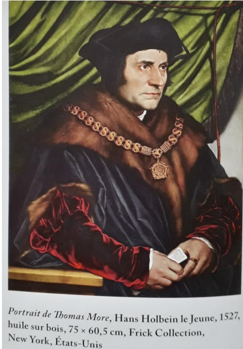
Portrait de Thomas More, Hans Holbein le Jeune, 1527, huile sur bois, 75 × 60,5 cm, Frick Collection, New York, États-Unis

Pourvu d'une lettre d'introduction d'Erasme, puisque c'est Erasme qui va adresser Hans Holbein à Thomas More, Holbein va se rendre à Londres depuis la Suisse en 1526. Il va pénétrer dans le cercle de Thomas More dont il fera effectivement le portrait en 1527. Un an plus tard, il achève le portrait du grand érudit, écrivain et homme d'Etat humaniste anglais. Avec ces couleurs soutenues et ces détails minutieux, Holbein présente More vêtu de riches étoffes de velours et de fourrures ; et la chaîne en or de sa charge qui indique son statut et sa loyauté au roi. Lorsque ce portrait fut peint, More était chancelier et duc de Lancaster.